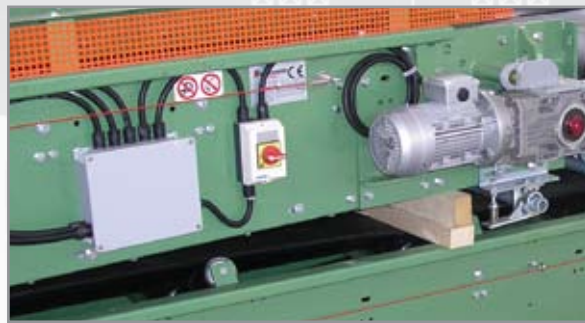
CABLAGGI ELETTRICI / ELECTRICAL INSTALLATION ON BOARD / INSTALLATION ELECTRIQUE À BORD