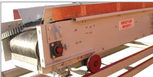
NASTRO CARRELLATO / CONVEYOR WITH LONGITUDINAL SHIFT CONVOYEUR AVEC TRANSLATION LONGITUDINAL